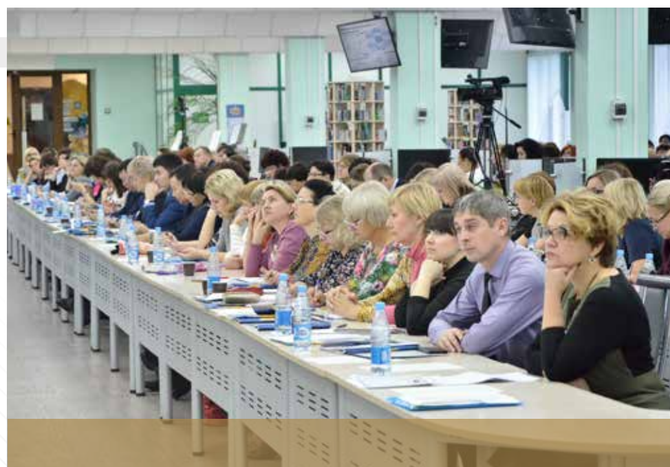
Formation continue des enseignants