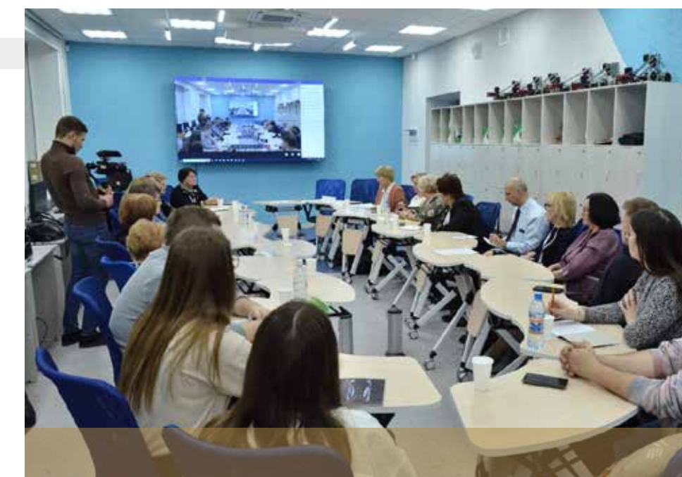
Formation à la gestion pour le système éducatif