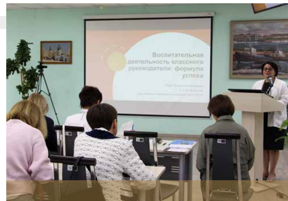
Services scientifiques et pédagogique du système éducatif