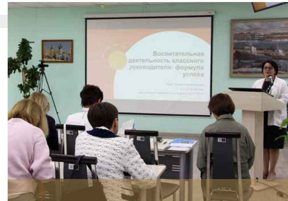
教育领域的科学和教 学法支持