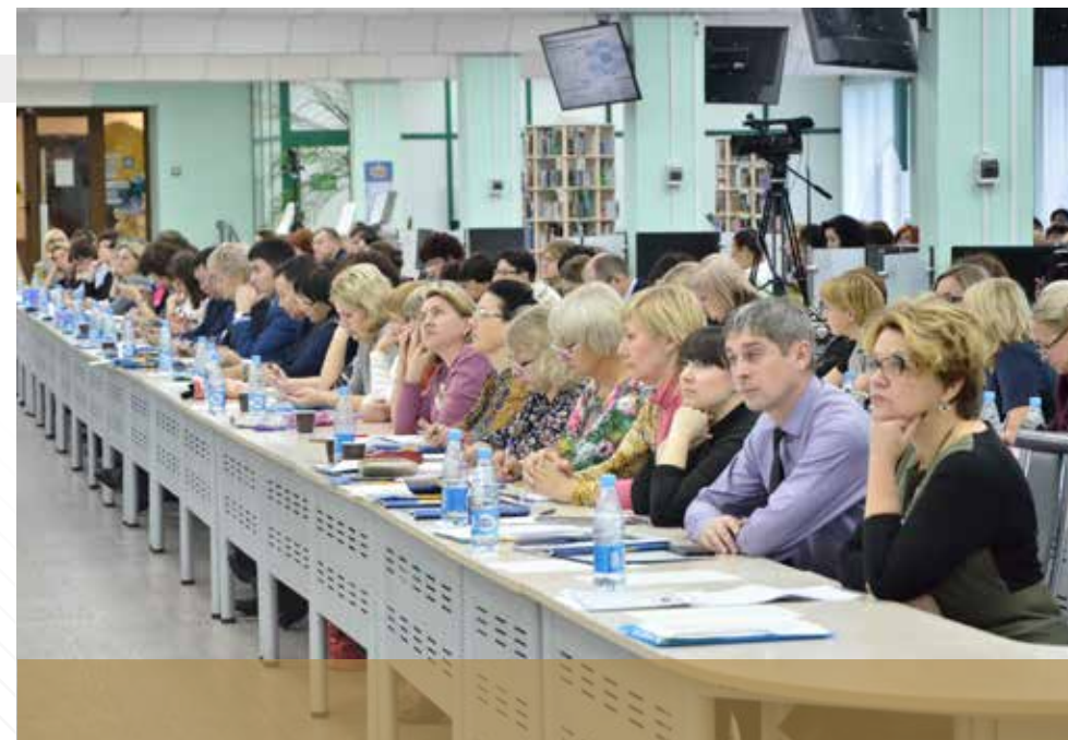
持续专业教学教育