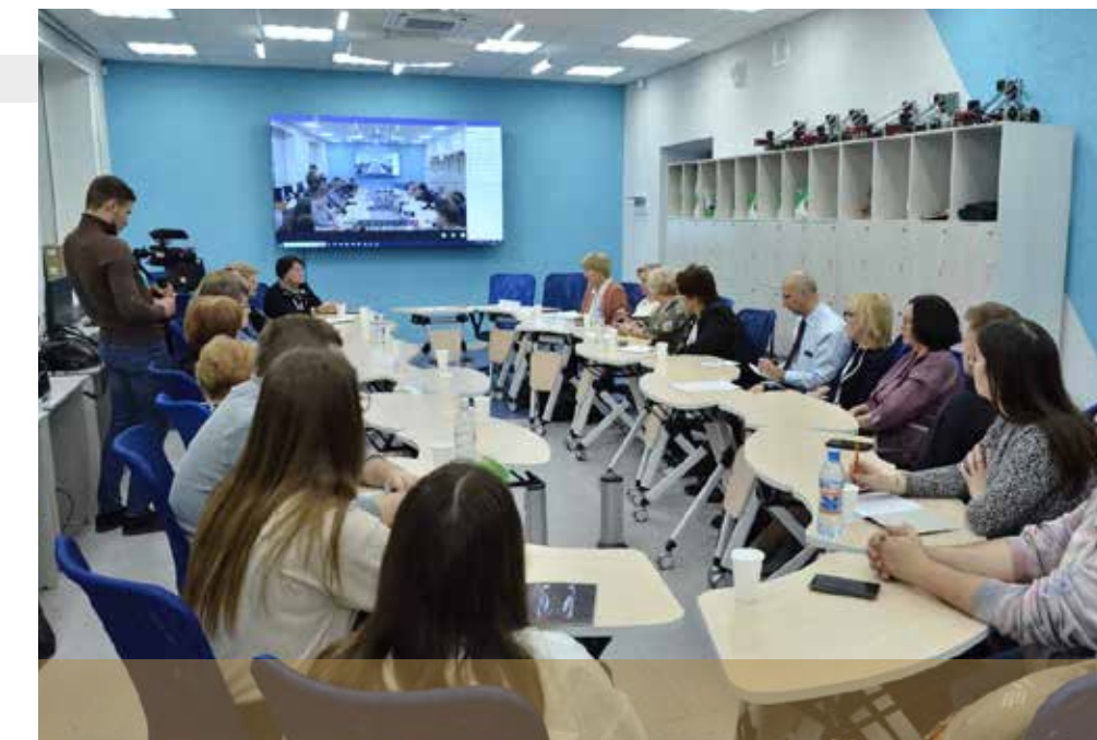
教育系统管理人员的 培训